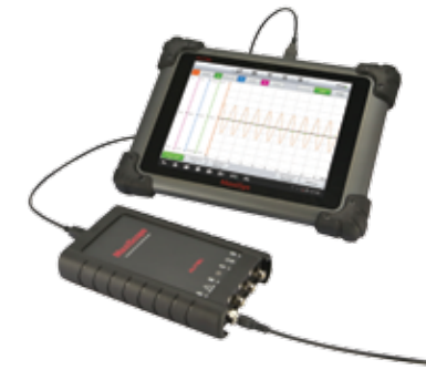
Optie MaxiScope MP408